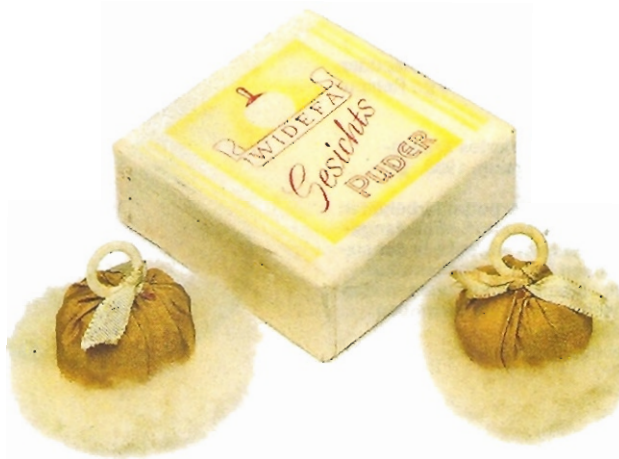
▲ „WIDEFA“. Gesichtspuder. Wiesbaden. RM 3. Quadratisches, spartanisches packaging. Goldfarbene Puderquasten aus den dreißiger Jahren.

Die berühmte „COTY“ der zwanziger Jahre. Das originale Design stammt von R. Lalique. 1920. (Abbildung oben)