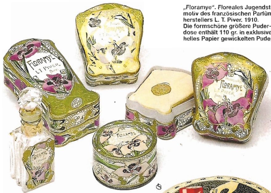
„Floramyne“. Floreales Jugendstilmotiv des französischen Parfümherstellers L. T. Piver. 1910. Die formschöne größere Puderdose enthält 110 gr. in exklusives helles Papier gewickelten Puder.

Bis dato waren für diejenigen – zahlreichen – Mädchen und Frauen, die keiner dieser beiden, eher exotisch anmutenden, Kategorien angehörten, nur ganz wenige Kosmetikartikel verfügbar und erschwinglich: Hausgemachte Gesichtslotionen, angerührte Cremes, hygienischer Puder auf Reisstärke- oder Talkumbasis und nach unschuldiger Sauberkeit und sorgfältig gestärkter Wäsche duften-