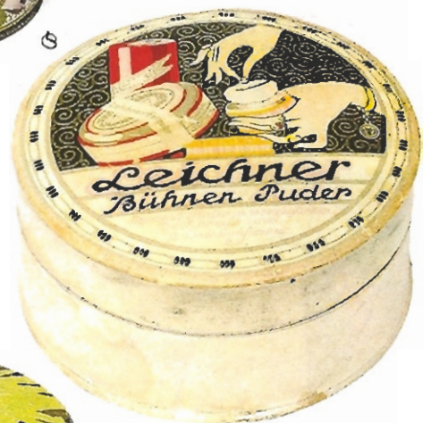
▲ Jahrhundertwende in Deutschland. Das Berliner Unternehmen „Leichner“ hatte sich auf Theaterkosmetik spezialisiert. Die Dose wird als Werbeträger für die eigene Produktpalette genutzt.

de Erfrischungswässerchen, im Stile des weltberühmten „Eau de Cologne 4711“.