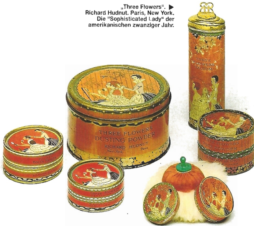
„Three Flowers“. ► Richard Hudnut. Paris, New York. Die „Sophisticated Lady“ der amerikanischen zwanziger Jahr.