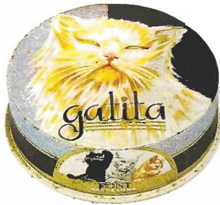
▲ „GATITA“, eine spanische Verführung. Barcellona, 1930.