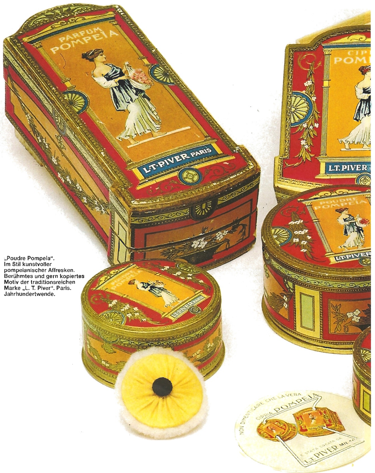
„Poudre Pompeia“. Im Stil kunstvoller pompeianischer Affresken. Berühmtes und gern kopiertes Motiv der traditionsreichen Marke „L. T. Piver“. Paris. Jahrhundertwende.