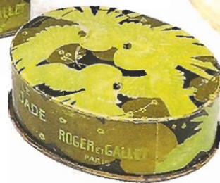
▲ „Le Jade“, von R. Lalique signiertes und im Auftrag der Pariser „Roger et Gallet“ realisiertes naturalistisches Motiv. Paris. 1915/20.