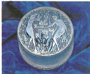
▲ R. Lalique. Seltener Glasbehälter für Gesichtspuder. Jugendstil. Paris. 1910. Signiert.