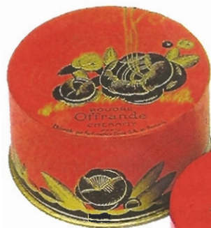
▼ „Poudre Offrande“ des Pariser „Cheramy“. Art Déco. 1920. ▼